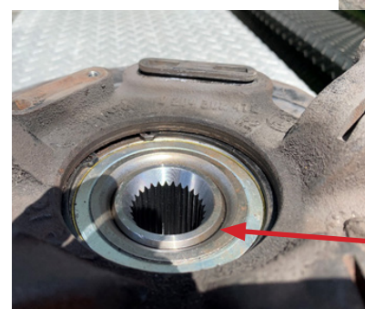
Esta maza está completamente asentada después de haber sido colocada a presión correctamente en el balero.