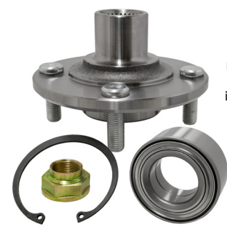
Nota: Los componentes necesarios para el cambio típico de una maza de balero GEN 1 incluyen un balero, una maza, un anillo de retención y una tuerca de eje.