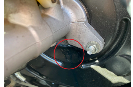
Fuga de líquido del cilindro maestro