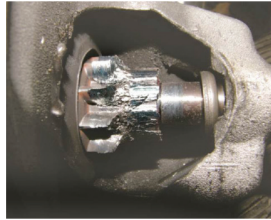
Engranaje de transmisión del motor de arranque dañado