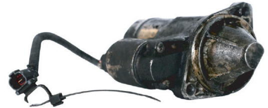
Motor de arranque empapado en aceite