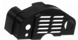
Resguardo diseñado por MPA.

Reemplace los sellos del árbol de levas de ser necesario. Si hay una fuga en los sellos del árbol de levas, puede tener que reemplazar la banda o cadena de tiempo.